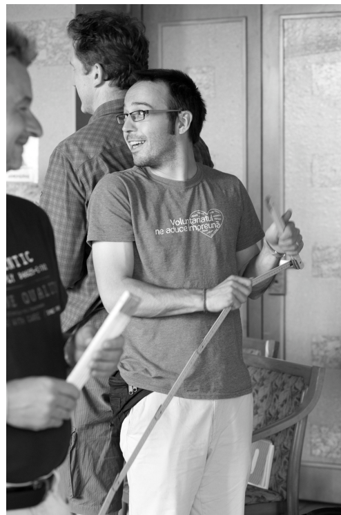
2015. ÖSVÉNY #1